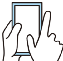
コンプライアンス研修